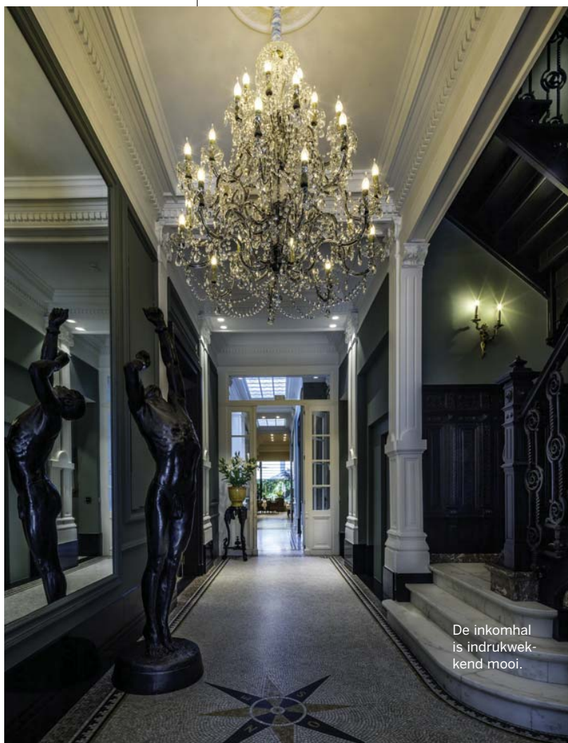
De inkomhal is indrukwekkend mooi.

INFO: Guesthouse Cabosse Sanderusstraat 19 2018 Antwerpen 03-689.52.12 www.cabosse.be